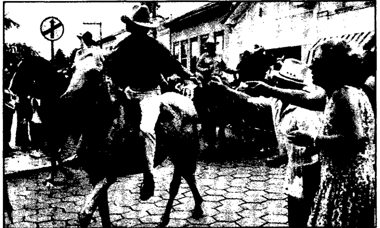
Desfile de cavaleiros