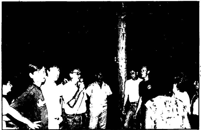
Inauguração da luz no Choroão

Parece que os órfãos estão ainda nervosos. A nova pracinha das três palmeiras, construída pela Prefeitura, perto da Igreja do Rosário é que está pagando o pato. Alguns desses "órfãos" estão quebrando as palmeiras e agora resolveram sujar os bancos de graxa. Um aviso: a Prefeitura já está com os nomes dos "órfãos" suspeitos.