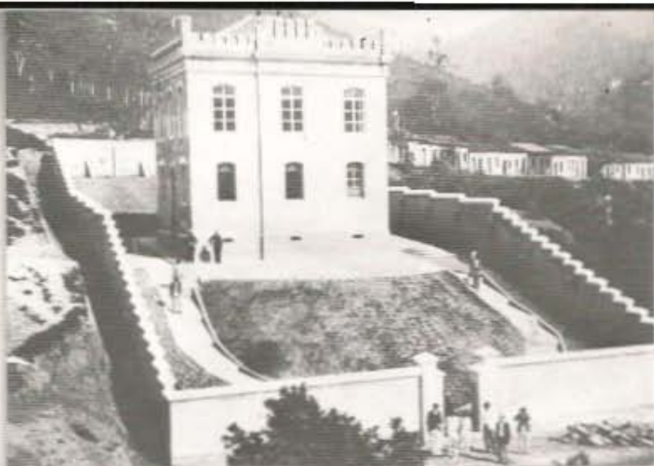
Prédio da Prefeitura em 1908