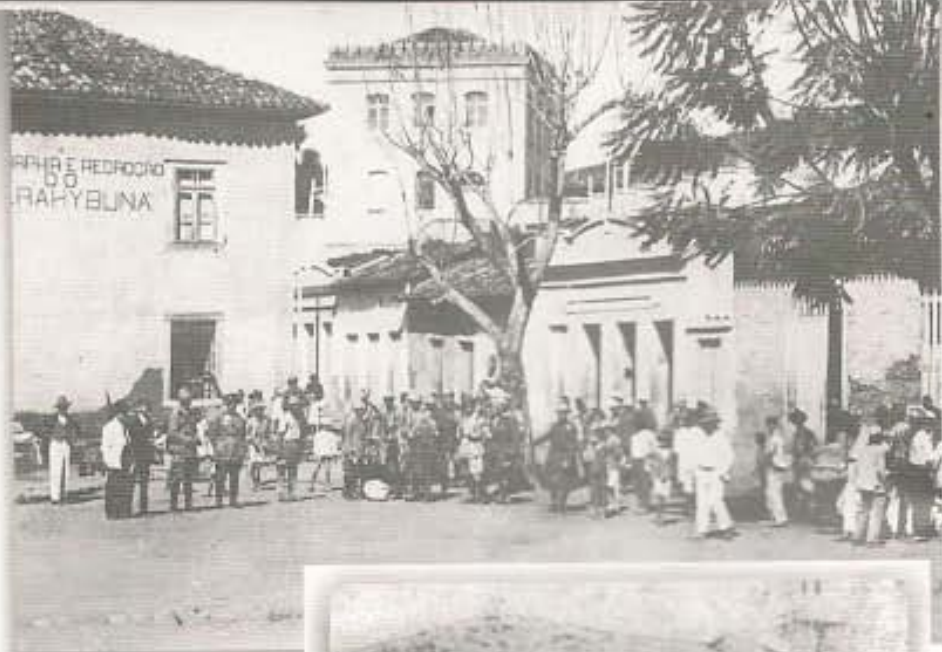
Acima, a redação do jornal "O Parahybuna", que circulou em 1932, com assuntos sobre a Revolução. Ao lado, a redação do jornal "O Parahybunense", em 1909.