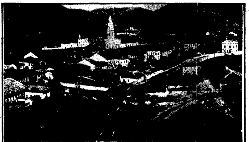
Parte da cidade de Parahybuna

Mostra fotográfica que será realizada em junho, mostrando a história de nossa cidade e nossa gente.