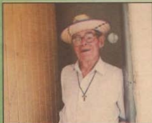
O homem de três séculos