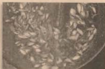
Criação de Lambari Tambiu na CESP