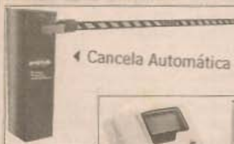
◀ Cancela Automática