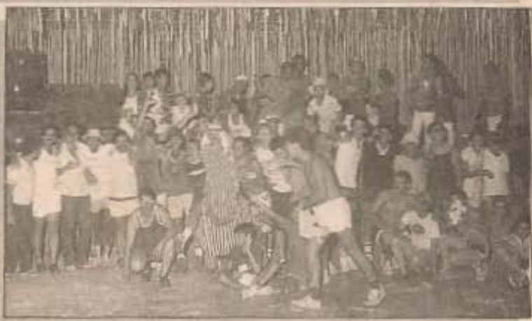
Carnaval de rua de 1981 e no Centro Comunitário em 1983.

70. Nesta época surgiram também os desfiles de blocos, chegando a participar até 6 grupos.