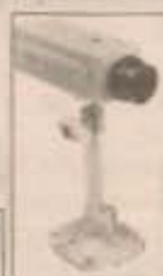
◀ Circuito Fechado de TV