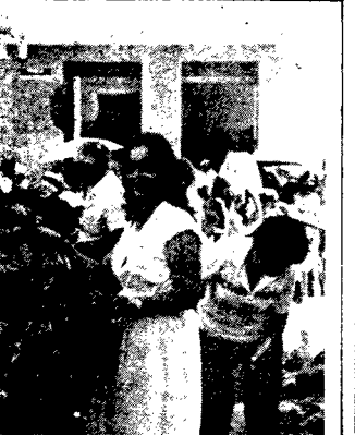
, entregando os presenças paraibunenses, reamembro.