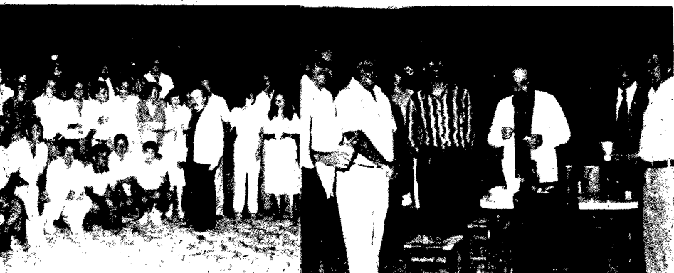
Promotores, Advogados, s na confraternização, dezembro.