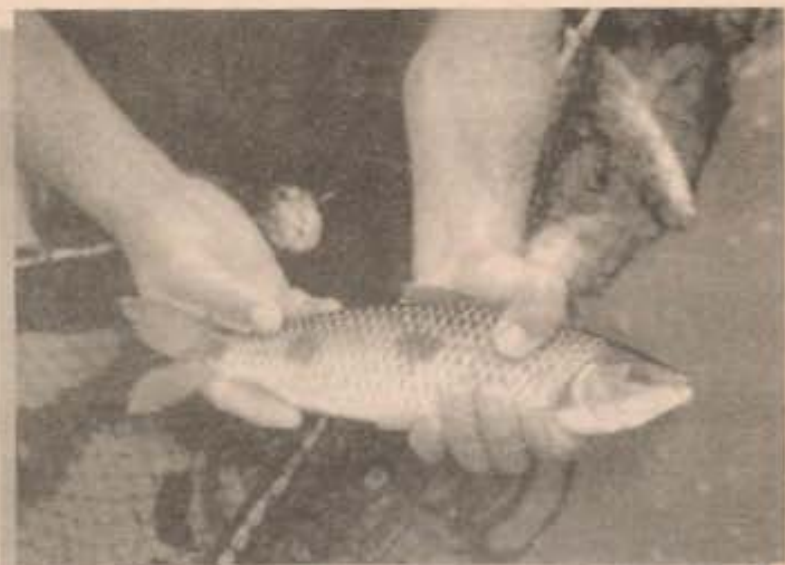
Reprodução de peixes

O trabalho dentro da estação, de agora em diante, será desenvolvido, continuando o que já vinha sendo feito e também ampliando