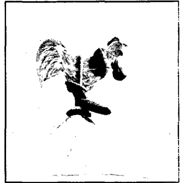
O galo, quem diria, foi enforcado pela minhoca