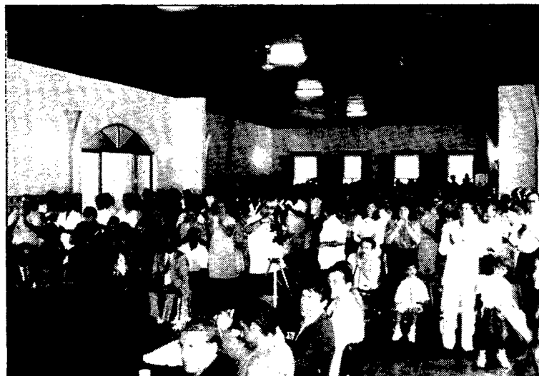
Povo marcou presença no Salão Paroquial...