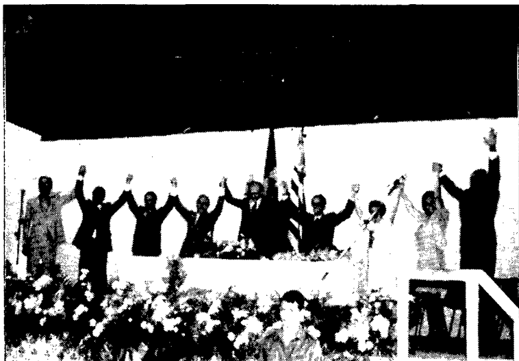
A posse dos vitoriosos no Salão Paroquial