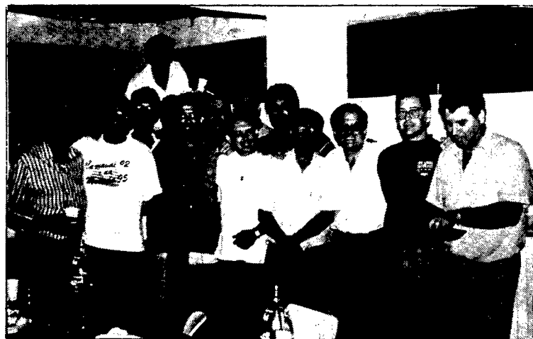
Toledo comemora vitória com amigos.