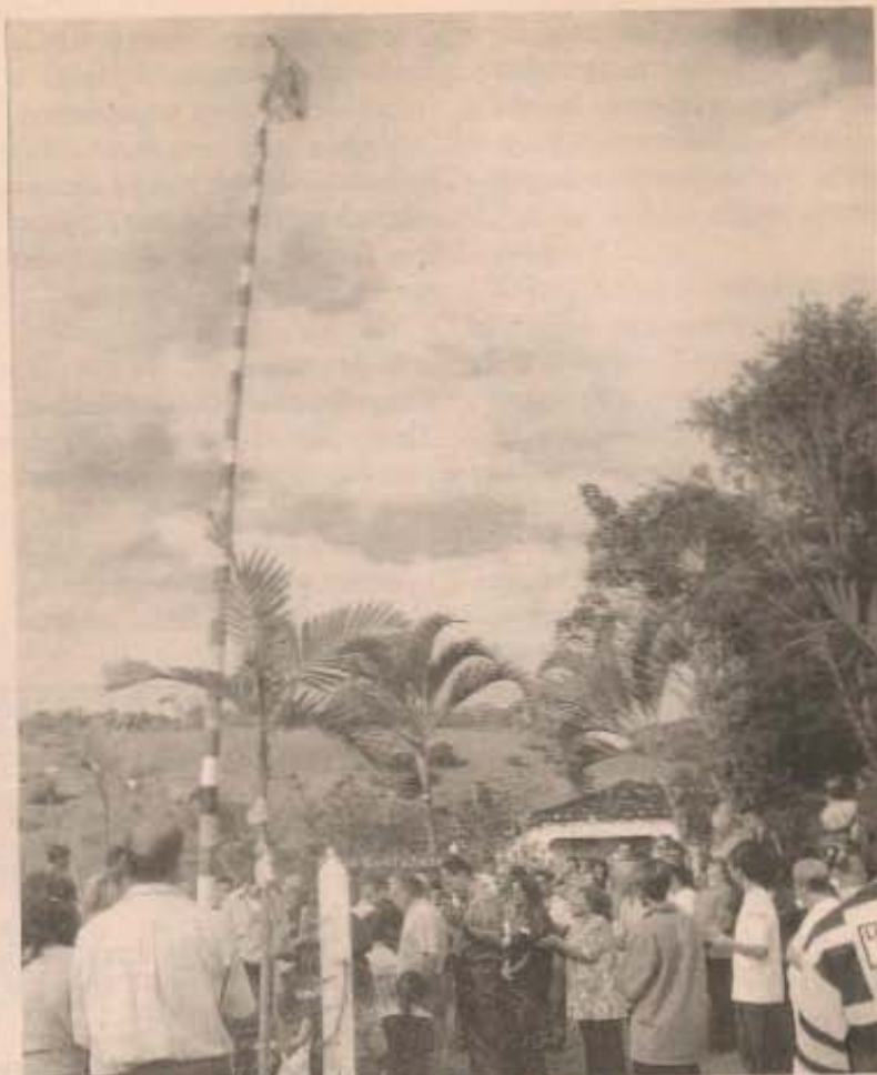
O mastro de São João é erguido na frente da casa

A festa nesta casa tem mais de cinquenta anos e o detalhe interessante é que ela é realizada de dia e com fogueira e tudo. O Compadre explica que passou a fazer a festa de dia, porque tinha muitas festas no município. Assim ele garantia a