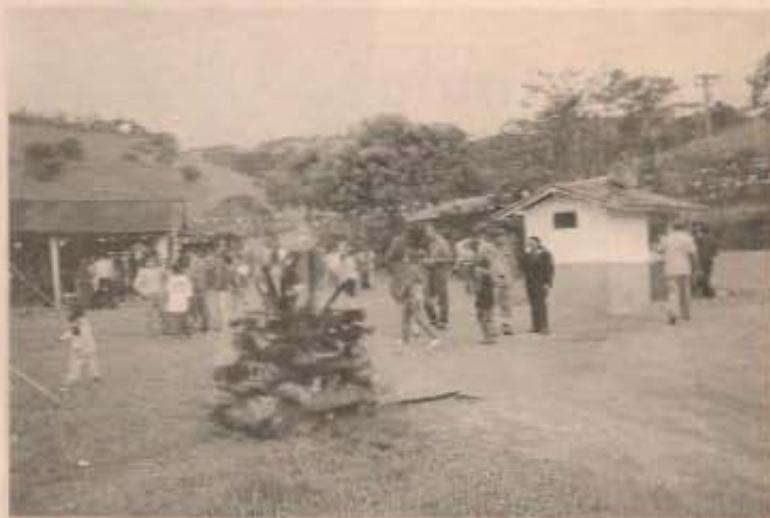
Acima, os convidados ocupam o terreiro da casa. Abaixo, a procissão do mastro de São João.

Muitos dos visitantes vão à esta festa todos os anos, devido a sua pureza e autenticidade, pois o casal ainda conserva os costumes antigos para homenagear o santo. Os convidados ficaram até o anoitecer, aproveitando a boa receptividade e a boa conversa do casal.