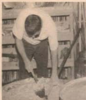
Açúcar mascavo, Fogado, Café, cavalaria e tapioca na festa