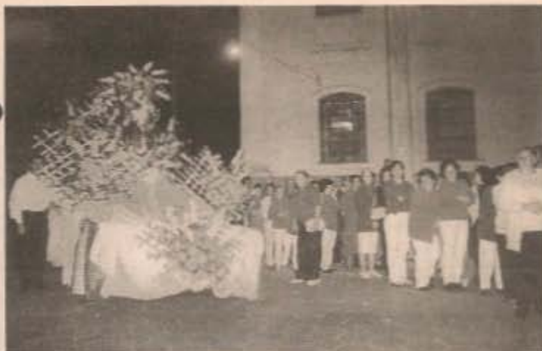
A Procissão fechou a programação religiosa da festa.

Foram quase 10 dias de muita festa em louvor a Sto Antonio e ao Aniversário da cidade. A festa começou no dia 9 de junho, com a inauguração do novo piso do Largo do Mercado, com discurso e show.