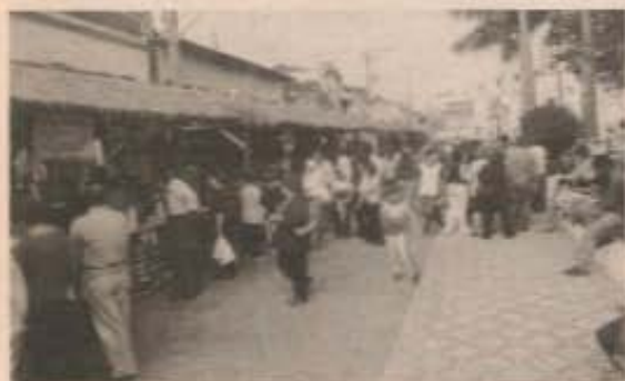
Feira do Turismo lotou todos os dias

Enfim, num balanço geral a festa foi boa novamente, com muita gente faturando e muitos se divertindo com o que tinha a disposição.