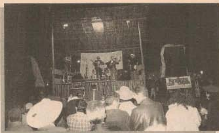
Violeiros mostraram músicas em palco típico