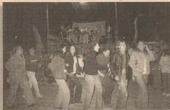
Rio Acima agitou dança da quadrilha

RENATO - O show mais esperado pelos paraibunenses e até mesmo pe-