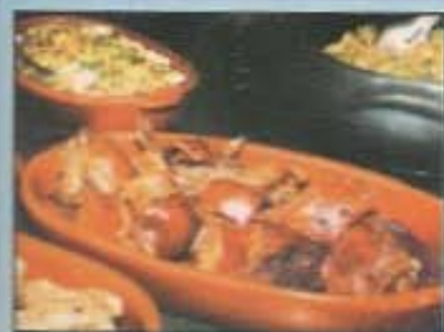
Porco na Páscoa