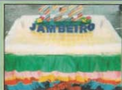
Festa em Jambeiro