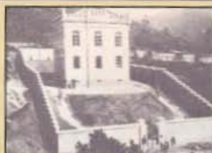
Cem anos de imagem