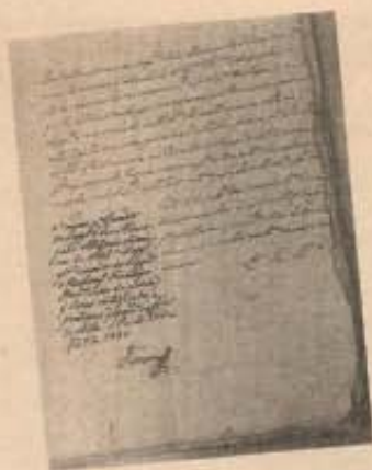
Cópia do processo de Caetana e a capa do livro escrito em inglês.

LEI - Somente no dia 26 de dezembro de 1877, por meio da Lei 6.515, foi finalmente formalizado o direito de nulidade ou anulação do casamento, por separação judicial.