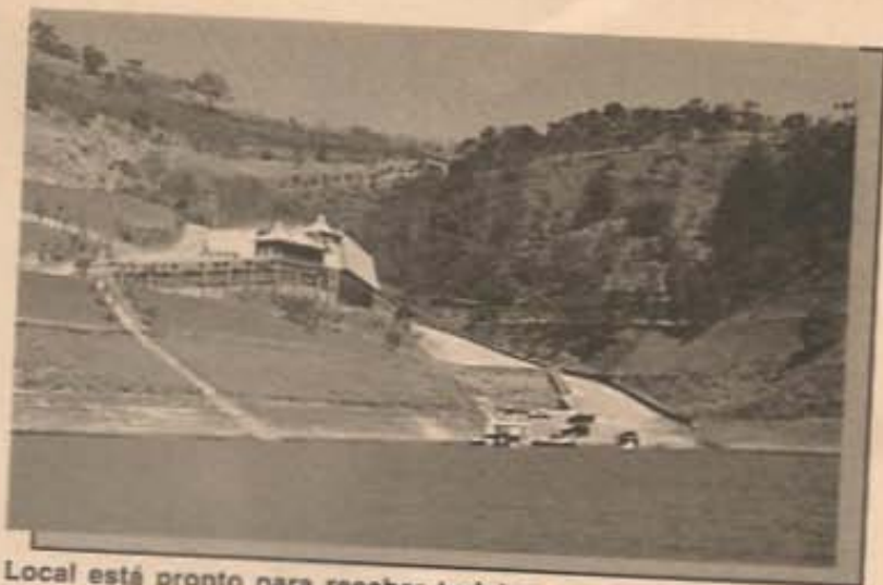
Local está pronto para receber turistas