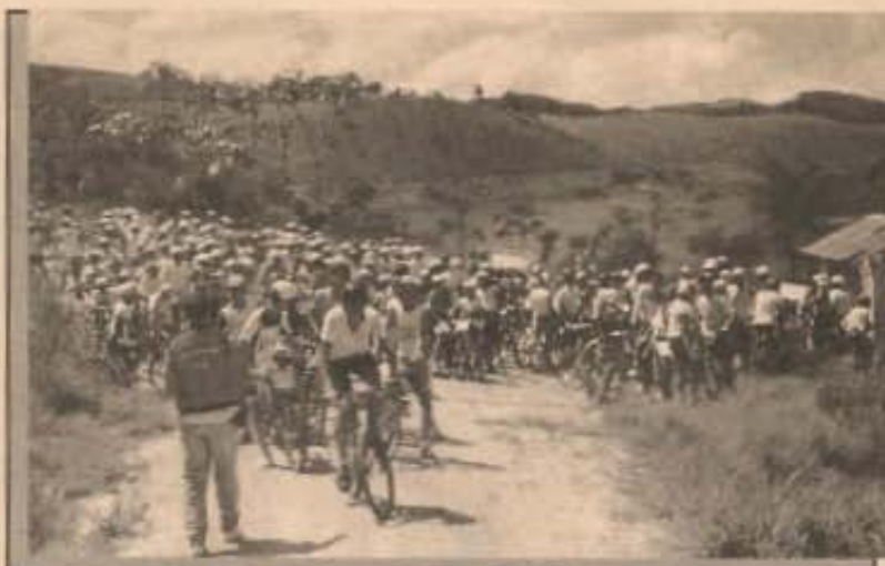
O primeiro Trip Trail realizado em 1983 e a Piabóia do ano passado

Naquela primeira prova, a cidade recebeu