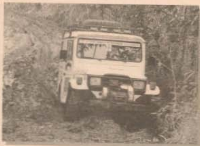
Jipeiros mostram garra pelas trilhas no meio da mata

da Prefeitura Municipal de Paraibuna e Pousada Paraibuna, terá trilhas pelos bairros da Laranjeira, Morro Azul, Patizal, São Paulo, Salto e São Germano. Serão percorridos cerca de 60 km, cujo