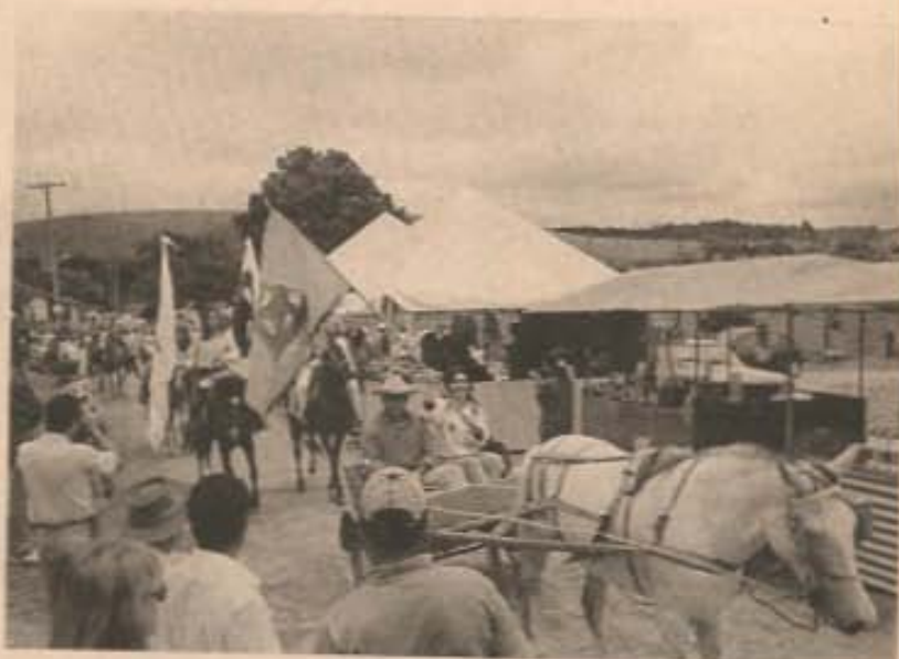
O grupo com cavalos e charretes, tem a participação de homens e mulheres.