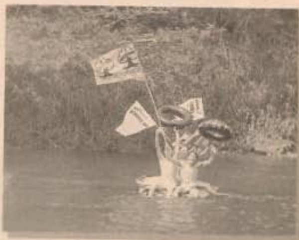
A primeira Piabóia, em 1982

O Piabóia, cujo nome é junção do peixe Piaba com a bóia, teve sua primeira edição em 1982, como um ato político da juventude.