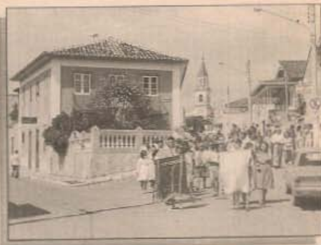
Fotos da Festa de São Benedito em 1979

festa deste ano tem ainda no domingo à noite, apresentação da Companhia de Moçambique de Paraibuna e convidados, Dança de São Gonçalo e show de violeiros.