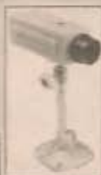
◀ Circuito Fechado de TV