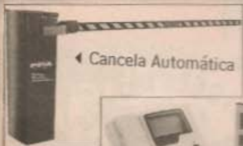
◀ Cancela Automática