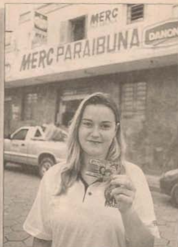
Cartão vai facilitar compras

O limite de compra será sempre determinado pelo