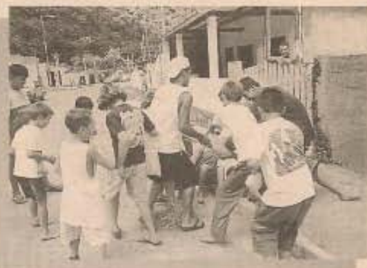
Judas é jogado e crianças fazem a festa.