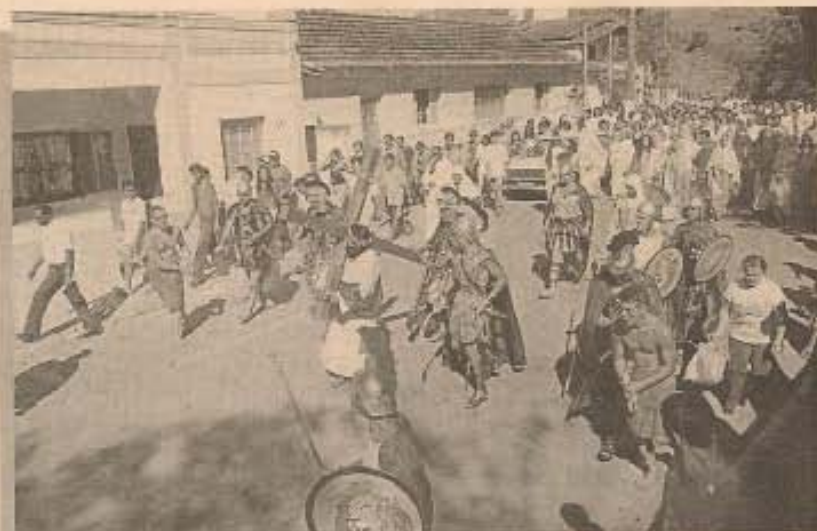
Acima e abaixo, encenação comoveu o público. Ao lado, a celebração na Igreja Matriz.

Via Sacra- A Sexta-feira Santa amanheceu com os cinquenta atores da Via-Sacra, se concentrando para o ato principal da semana. Às 13h teve início a encenação a partir do trevo da entrada da Vila de Fátima. A encenação foi acompanhada por sermões ressaltando o tema da Campanha da Fraternidade "Vida Sim, Drogas Não". Seguiu pela Rua do Colégio e depois pela Aurélio Silva Santos. A cena principal,