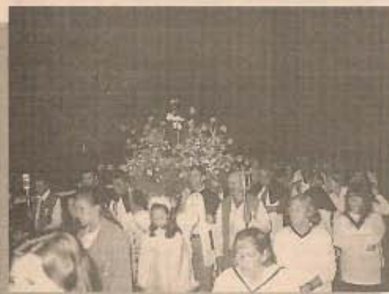
Procissão percorreu ruas da cidade e Capela lotou o dia todo

procissão pelas ruas da cidade, finalizando com a missa campal, no prédio da CEDRAP. A noite fechou com shows de violeiros e quermesse.