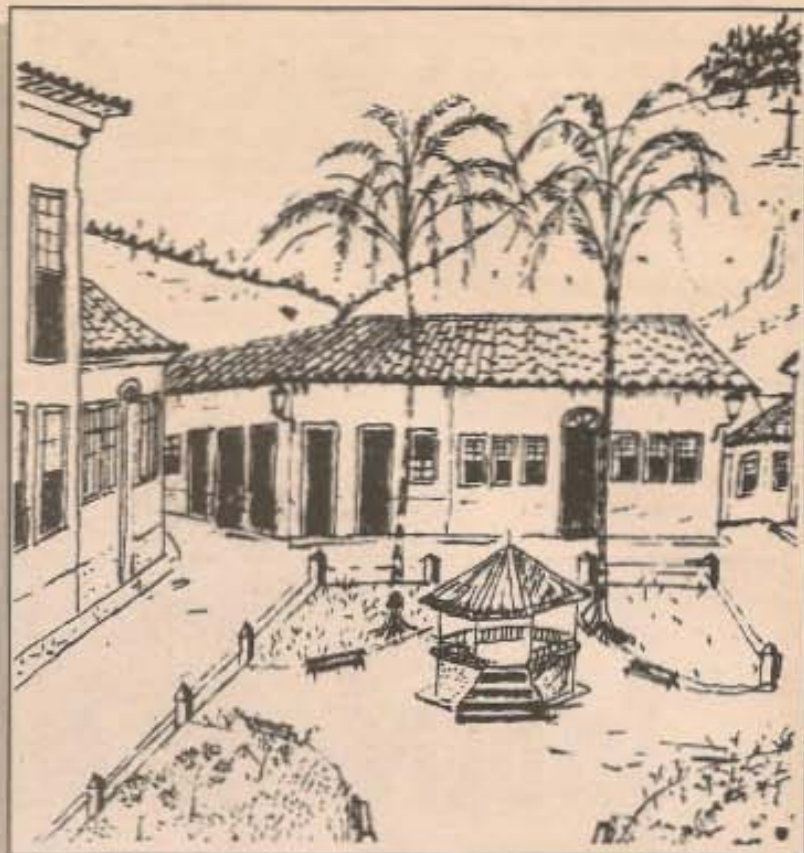
No desenho de Seu Siqueira, a Praça, local dos encontros.

As meninas tinham que ir à reza todos os dias. Entravam em fila, ofertavam rosas à Nossa Senhora e ficavam na cerimônia até o final. Elas entravam na Igreja, davam